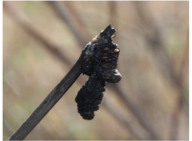
イモムシ(種名不明)