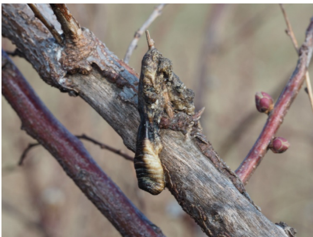
ミミズの仲間(種名不明)