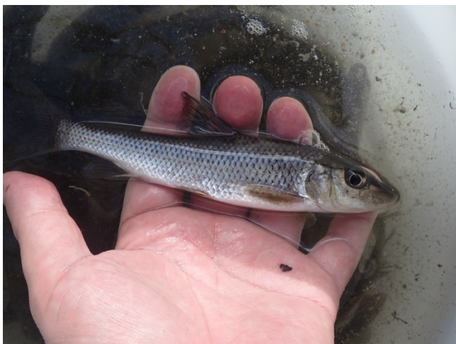
ニゴイ( Hemibarbus barbus )