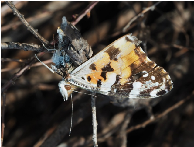
ツマグロヒョウモン