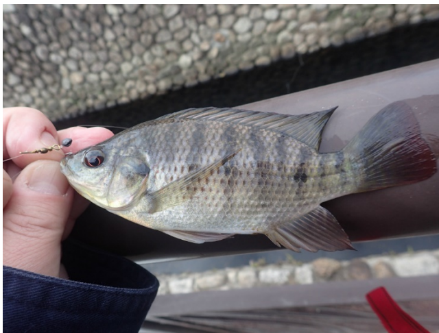
ナイルテラピア( Oreochromis niloticus )