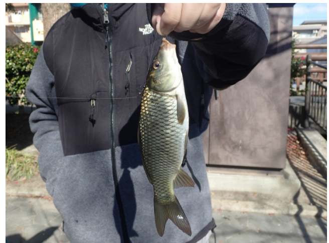
コイ( Cyprinus carpio )