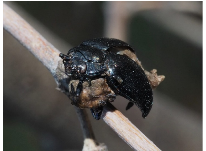
マメコガネの仲間(種名不明)