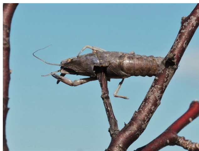
アメリカザリガニ